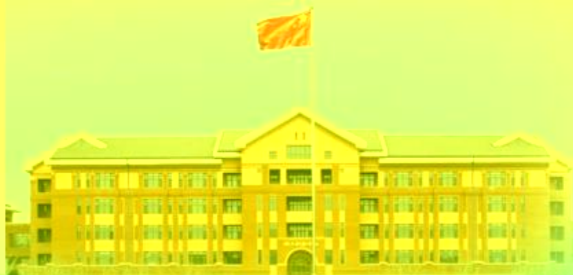
天津机电职业技术学院 TIANJIN VOCATIONAL COLLEGE OF MECHANICAL AND ELECTRICAL TECHNOLOGY